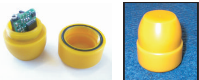
Especialmente diseñado para Chick Master con los estándares más altos de la industria