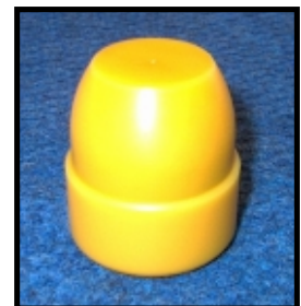
Especialmente diseñado para Chick Master con los estándares más altos de la industria