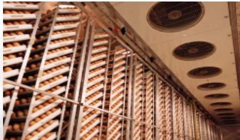
Incubadora multi-etapa Buckeye operando en modo de etapa única.

Si usted está considerando la conversión de su planta de incubación multi-etapa a una planta de etapa única pero se asusta al pensar